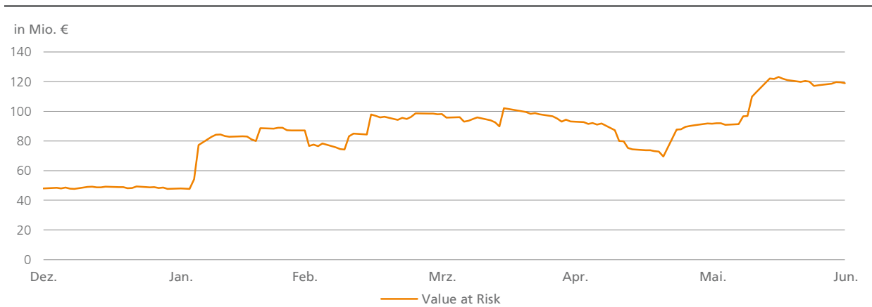
ABB. 26 – SEKTOR BANK: HANDELSTÄGLICHE ENTWICKLUNG DES MARKTPREISRIKOS 1

1 Value at Risk bei 99,0 Prozent Konfidenzniveau, 1 Tag Haltedauer, 1 Jahr Beobachtungszeitraum auf Basis eines zentralen Marktpreisrisikomodells für den Sektor Bank. Die Risiken wurden unter vollumfänglicher Beachtung von Konzentrations- und Diversifikationseffekten ermittelt.