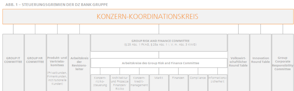
ABB. 1 – STEUERUNGSGREMIEN DER DZ BANK GRUPPE

Der Konzern-Koordinationskreis ist das oberste Steuerungs- sowie Koordinationsgremium der DZ BANK Gruppe. Ziele des Konzern-Koordinationskreises sind die Stärkung der Wettbewerbsfähigkeit der DZ BANK Gruppe und die Koordination in Grundsatzfragen der Produkt- und Vertriebskoordination. Außerdem beabsichtigt das Gremium, die Abstimmung zwischen den wesentlichen Unternehmen der DZ BANK Gruppe im Hinblick auf eine konsistente Chancen- und Risikosteuerung, die Kapitalallokation, strategische Themen sowie die Hebung von Synergien zu gewährleisten. Dem Konzern-Koordinationskreis gehören der Gesamtvorstand der DZ BANK sowie die Vorstandsvorsitzenden der BSH, DZ HYP, DZ PRIVATBANK, R+V, TeamBank, UMH und VR Smart Finanz an.